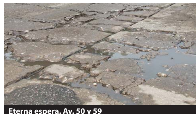
Eterna espera. Av. 50 y 59

Cada vez con mayor frecuencia, he de encontrarme con algún que otro vecino de esta ciudad, desconforme con la gestión municipal. Me expresan su hartazgo, por mi rol de informar la realidad, como si pudiera darles al menos una solución. Cansado ya de hablar cara a cara con los responsables, con los secretarios o hasta con el mismo intendente en persona, no encuentran respuesta a los reclamos que cada vez son más y más.