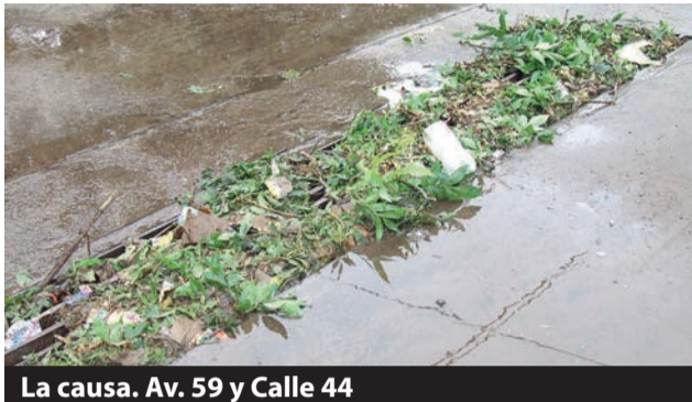
La causa. Av. 59 y Calle 44