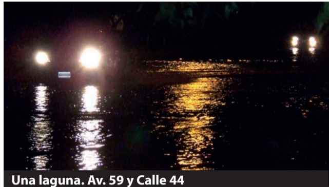
Una laguna. Av. 59 y Calle 44

El temporal de intensas lluvias durante tres días dejó al descubierto que tan vulnerable se puede convertir una ciudad cuando en materia de prevención, atención y asistencia civil nada se hace. ¿120 mm son los culpables de haber caído justo en vísperas de un fin de semana largo? o ¿Qué los recursos de fondos, de mano de obra e infraestructura se destinan a otra "prioridad"?