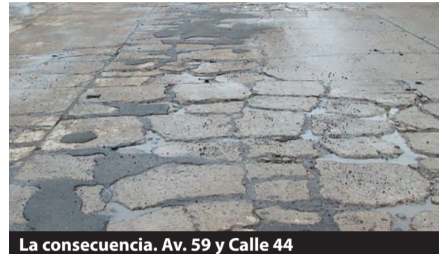
La consecuencia. Av. 59 y Calle 44