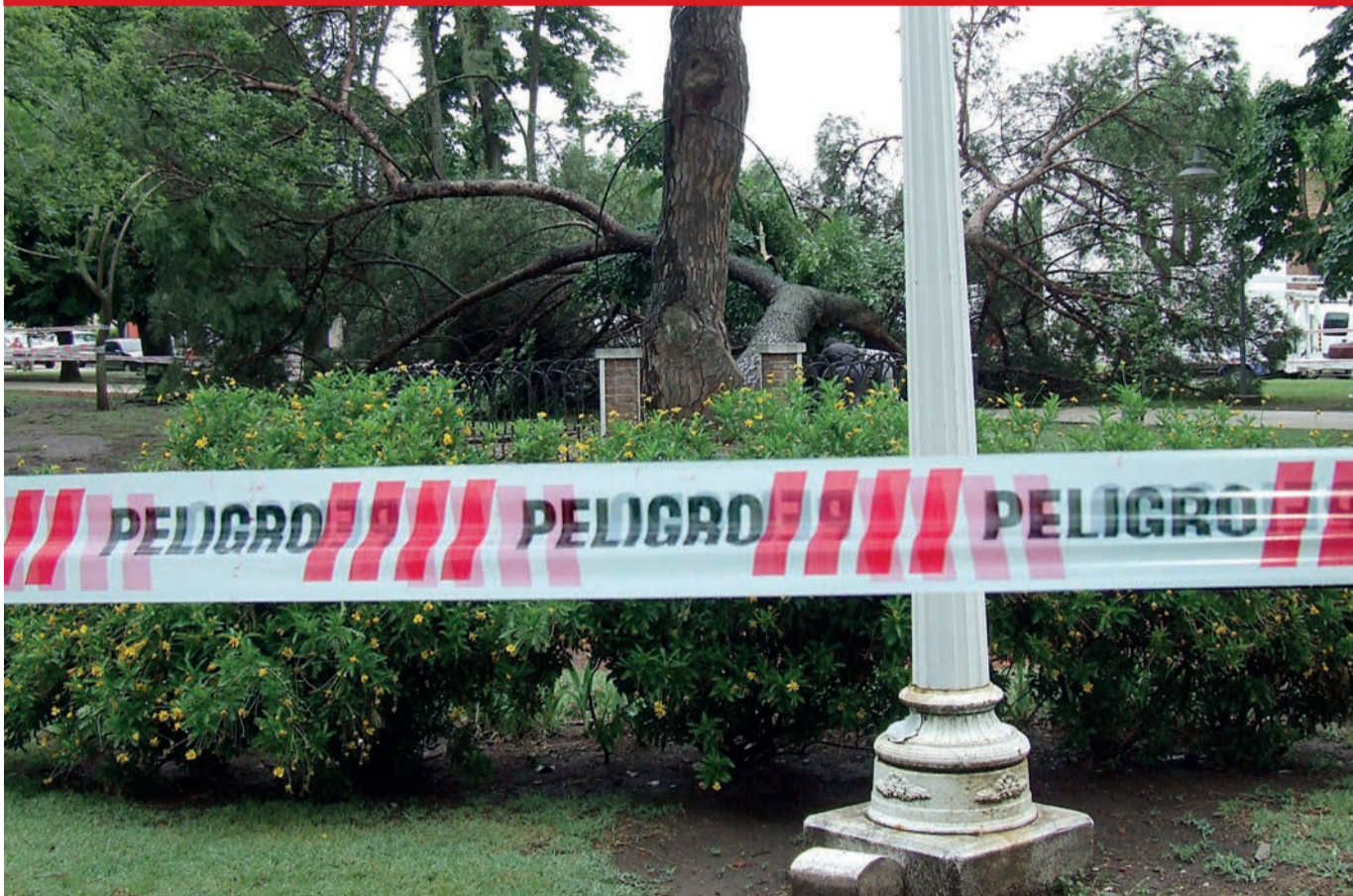
Emblemático árbol caído de la Plaza 9 de Julio por falta de poda correctiva, que fue escenario para los recién casados.

SE REGLAMENTÓ LA LEY DE PROTECCIÓN PARA PREVENIR LA VIOLENCIA CONTRA LAS MUJERES