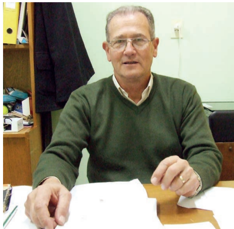
24 horas y en las oficinas de Calle 55 N° 330, dentro del horario de oficina", finalizó el gerente de la cooperativa. ■

"Por otro lado el ENRESS (Ente Re- gulador de Servicios Sanitarios) que es otro ente provincial, nos obliga que hasta tanto nosotros finalicemos la obra a brindar un servicio alternativo de dos litros de agua por persona y por día para consumo únicamente en la Planta Potabilizadora Ruta 94 las