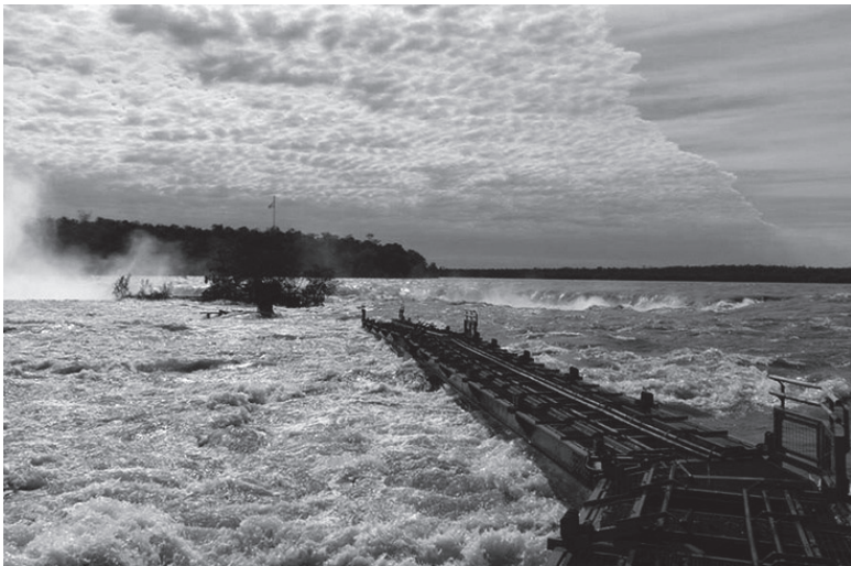
La zona de la Garganta del Diablo permanece cerrada al público.