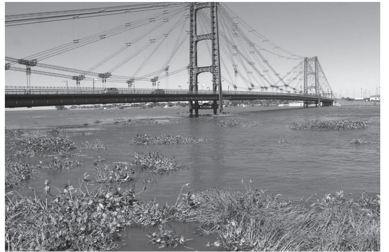
Camalotes en la laguna Setúbal, en Santa Fe, el sello de la crecida del río Paraná.