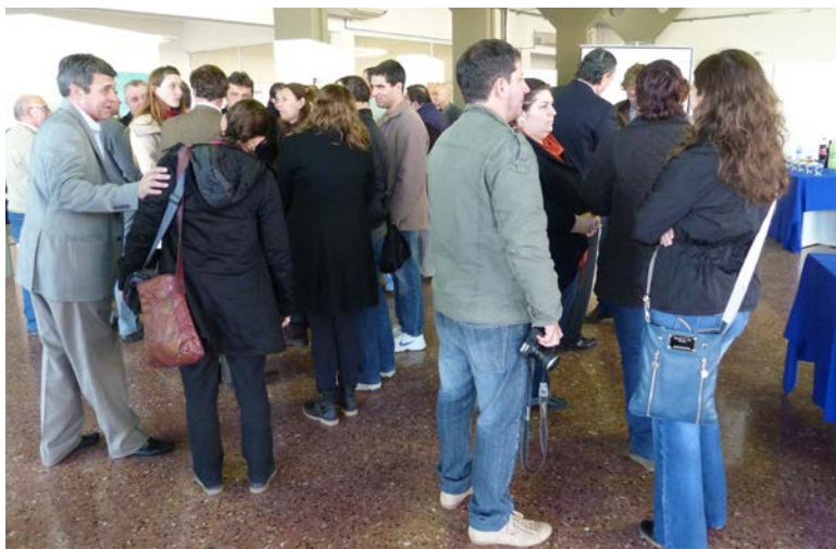
Semanario Leguas unico medio de Villa Cañás presente en el acto de agasajo

En alusión a la actividad de los medios, Galassi también se refirió a la futura puesta en funcionamiento de un canal de televisión provincial asegurando que "sumaremos desde el estado una nueva voz a las múltiples voces, textos e imágenes que ustedes generan cotidianamente y lo ha-