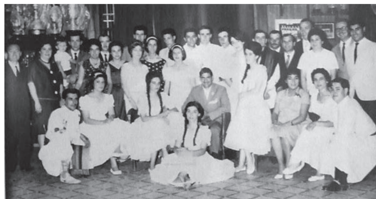
Miembros de la Sub-comisión junto a varios integrantes de la peña (Festival Reg. 1963)

La peña hoy está integrada, en la parte de baile, por los más chiquitos que es el grupo "Rancherita", que van niños de 5 a 9 o 10 años, después pasan al grupo intermedio, hasta los 14 años, y de allí al ballet, que son chicos de 16 años en adelante. También hay un gru-