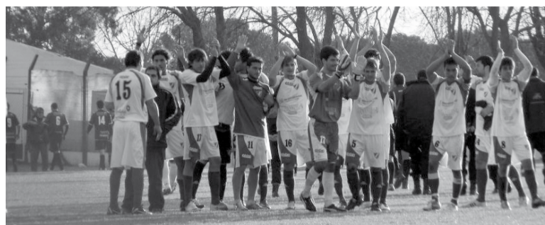
El dulce hola, el triste adiós. Juventud festeja, Studebaker se va derrotado.

tras más capacidad de reacción tiene un grupo ante las adversidades, más explosiva es la revolución que puede ejercer en poco tiempo. Así sucedió. Una ráfaga de avances furiosos en el conjunto dirigido por Mancini provocó un streptese en la última línea de los campeones. A tal punto que en solamente sesenta segundos cambió el rumbo del duelo y del torneo.