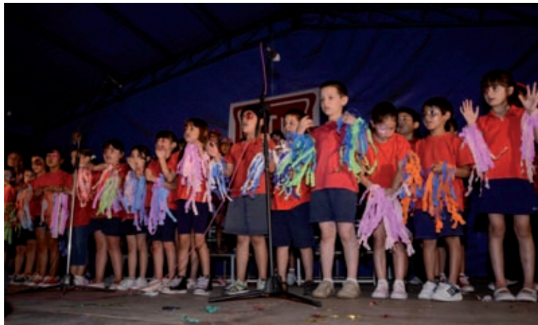
Fiesta de la Música. Organizada por la Escuela Normal Superior N° 38.