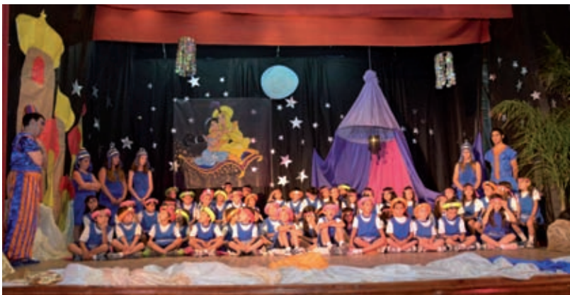
Promoción 2011 - Jardín de Infantes N° 29