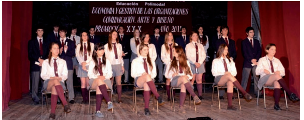
Arriba: Promoción 2011 Comercial Colegio San José.