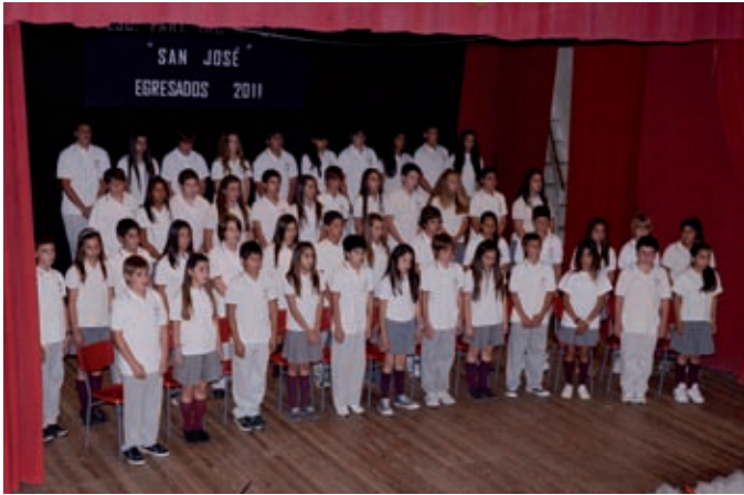
Promoción 2011 - 7mo. grado - Colegio San José.