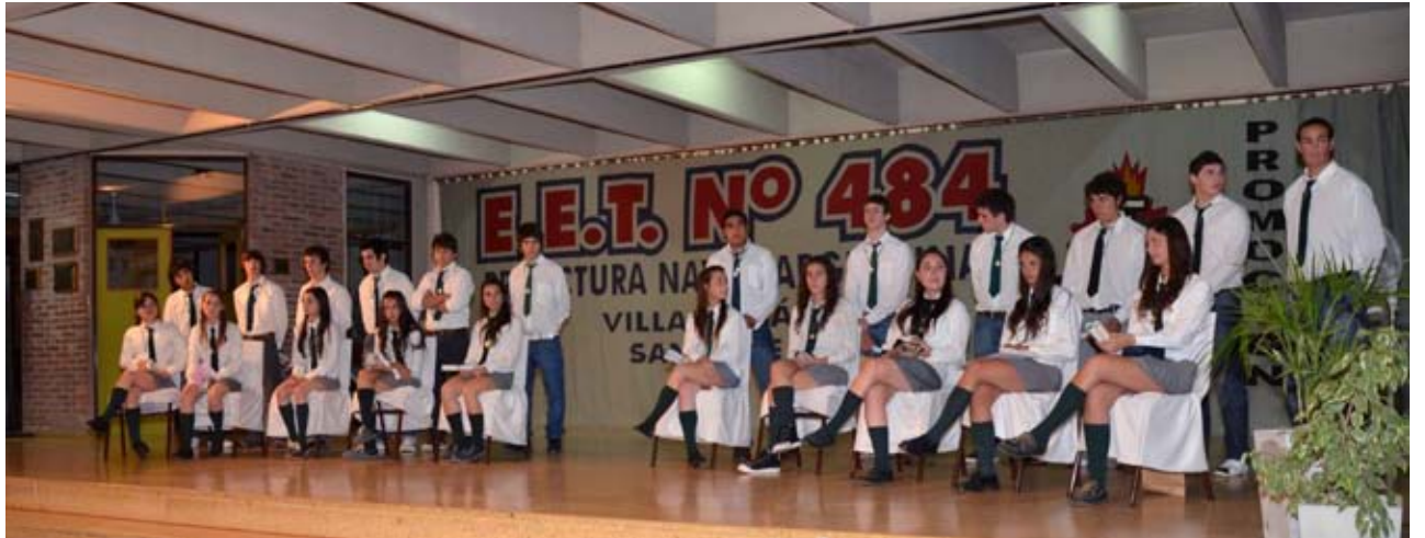
Promoción 2011 E.E.T N° 484