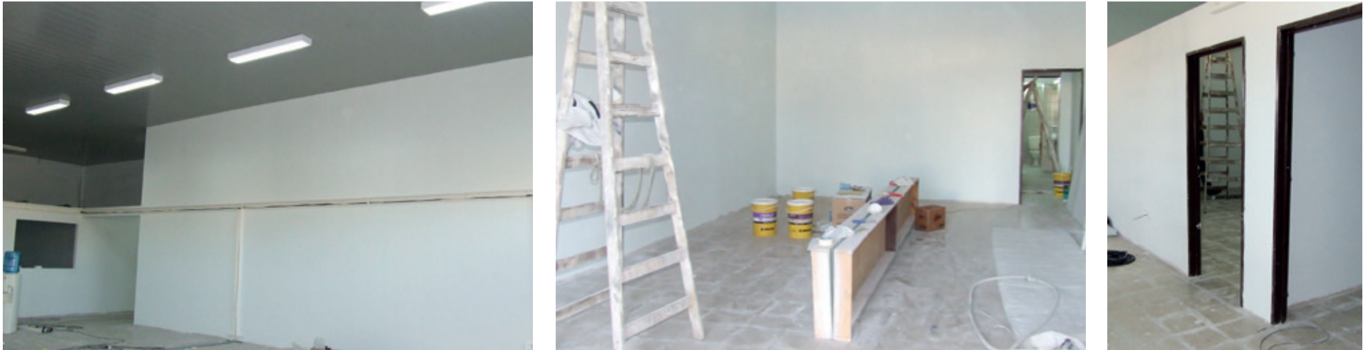
En la primera fotografía se puede apreciar el sector destinado a la atención del público en general. En la segunda, la futura sala de conferencias. Por último se ve el archivo y la gerencia.

Con una cuota de ansiedad y deseos difíciles de controlar nos acercamos para ver como vienen los trabajos en la futura UDAI de Villa Cañas.