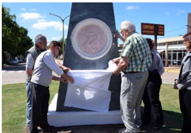
En el marco de los festejos y homenajes de los 25 años de Villa Cañas Ciudad, se realizó en un breve acto la inauguración del monolito en homenaje de Don Juan Cañas y Rey.