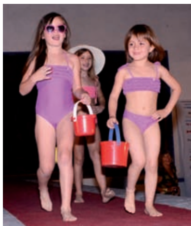
Apertura de la temporada de verano 2011/2012 de la pileta del Club Sportsman C. S y D., Desfile Moda Show a cargo de C-Fiore y Chocolate Shoes.