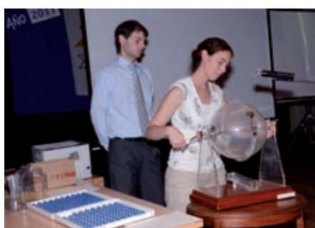
El 1 de diciembre se llevó a cabo el sorteo de las 20 viviendas del nuevo complejo habitacional que llevará el nombre del Padre Juan Riganelli. El acto se llevo ante Escribano Público y se desarollo en el Centro Cultural Municipal ante la presencia de autoridades provinciales y municipales como así también de todos inscriptos correspondientes.