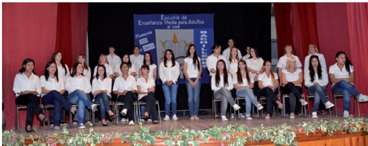
Promoción 2011 Bachiller de la Escuela de Enseñanza Media para Adultos N° 1308