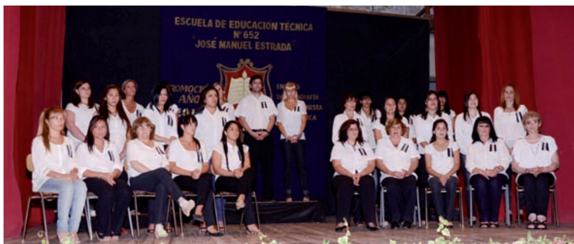
Arriba: Promoción 2011 de la Escuela de Educación Técnica N°652 Jose Manuel Estrada. Abajo: Promocion 2011 Curso Pymes de la Escuela Normal Superior N°38 Domingo Faustino Sarmiento.